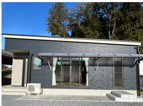
ご夫婦、猫ちゃん2匹と暮らす平屋

打合せ、設計、施工監理を担当させて頂きました。リビングの床材は、畳をメインとし、こたつでゆつくりできる空間に。キッチンからリビングを見渡せ、お料理しながら夫婦で会話できる。各部屋への行き来も段差を配慮。キャットウォークを取り入れるのが憧れだったと。猫ちゃん達の安全を考え、自由に限られたエリアだけ行き来出来るペット用ドアやトイレの採用など施主様の愛情が沢山詰まったお家が完了しました。入居後の様子を伺いすると、日中は採光で部屋が明るく、温かく